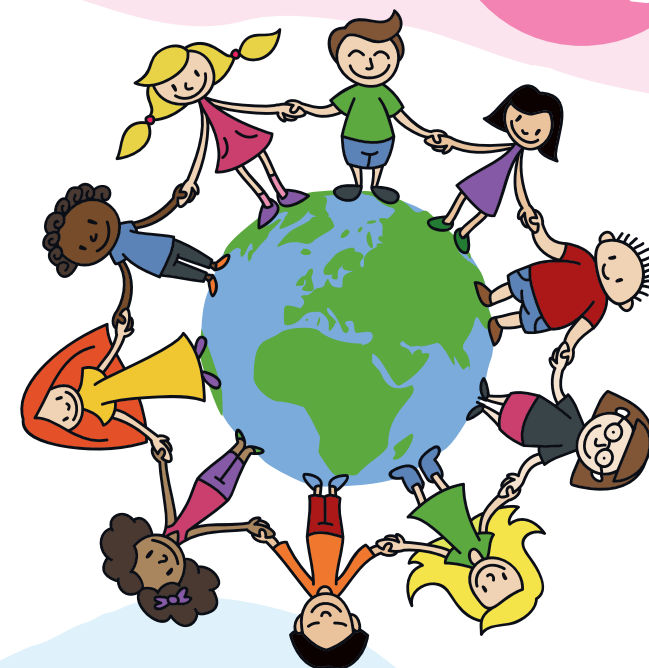
Stand Nov. 2021 · Gestaltung: Bettina Brand, München · Zeichnungen: Rudie/fotolia.com

Neue Fortbildungsgruppe: Start am 7. März 2022